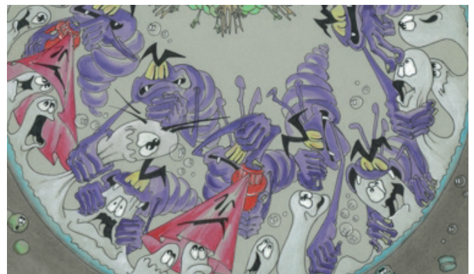
Een slappe darms, zeer gevoelig voor bacteriële infecties. L'intestin est fragile