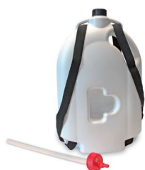
Sac à dos mousse