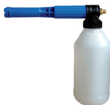
Lance à mousse