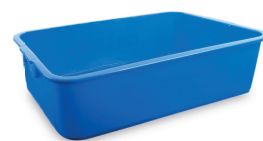
Bac de désinfection