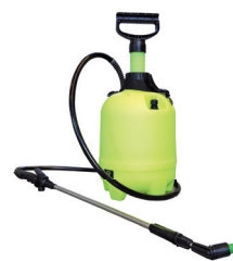
Pulvérisateur à dos

Virocid a prouvé son efficacité contre le virus de la Grippe Aviaire (Avian Influenza) à 0,25%. Demandez-nous conseil pour la désinfection des moyens de transport à des températures inférieures au point de congélation.