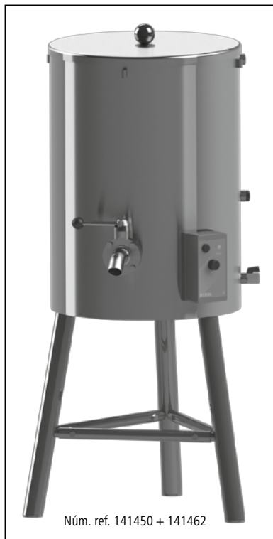
Núm. ref. 141450 + 141462